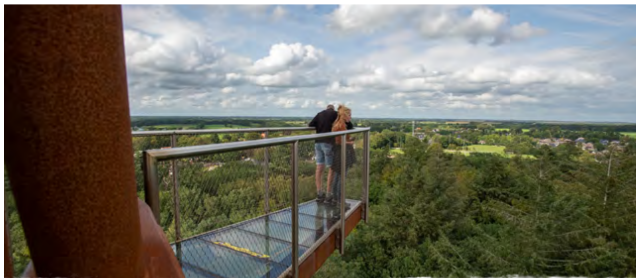
Uitzicht vanaf de Bosbergtoren; Appelscha