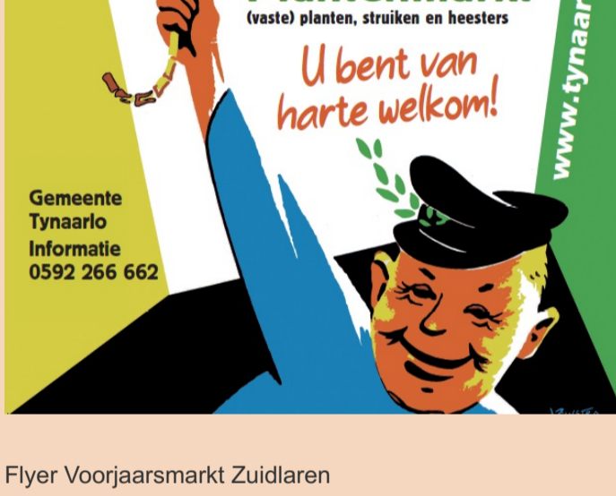
Flyer Voorjaarsmarkt Zuidlaren

Daarnaast zijn #JongTynaarlo en de cultuurcoaches aanwezig én de buurtsportcoaches hebben een activiteit namelijk een fietstocht. Zie hieronder de flyer voor meer informatie.