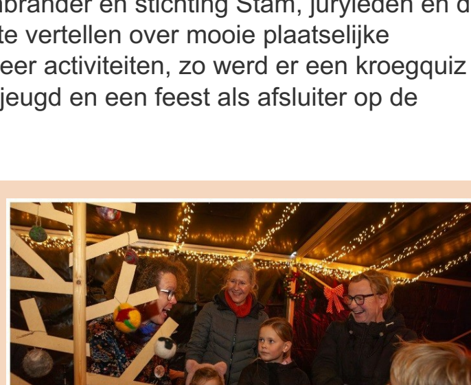
Workshop kerstballen viltten met Mooimiek